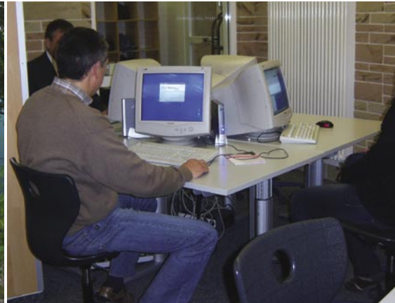
In der Bibliothek des CJD können Schüler, Lehrer und Projektgruppen den Bibliotheksdrucker nutzen.

Schon bald will der Administrator die Print-Cards mit dem Logo der Schule versehen, dies lässt sich einfach über die entsprechende integrierte Funktion beim Ausdrucken der Print-Cards realisieren.